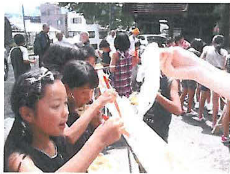
みんなで楽しく流しソーメン