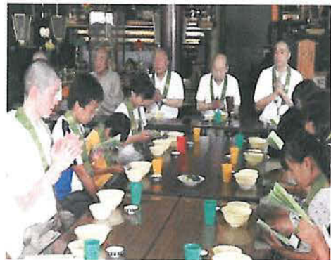
食事の作法。命をいただく